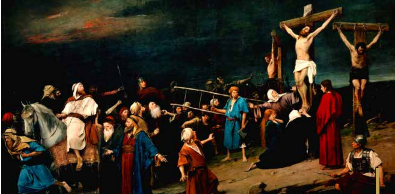
Munkácsy Mihály, Krisztus-trilógia – Golgota